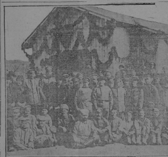
PRISONERS OF WAR IN GERMANY. In the accompanying illustration are shown Russian prisoners of war under guard of German soldiers.