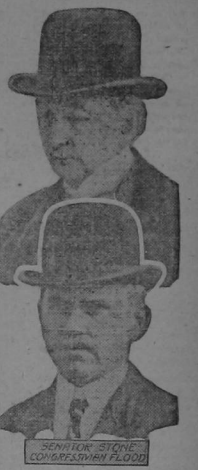
SENATOR STONE CONFESASUO EL PAGO

bierno para salir de Washington, por que acepta la posibilidad de que el Tratado entre Colombia y los Estados Unidos no será ratificado por el Senado en su forma original. Se sabe que se retirará definitivamente si el tratado no es aprobado o si el Senado acepta el informe de su Comité de Relaciones Exteriores reduciendo la indemnización por la separación de Panamá de veinticinco a quince millones y haciendo mutua la satisfacción por ese hecho. El señor Betancourt dijo esta noche: "Estoy esperando la decisión del Senado para informar a mi Gobierno, el cual enviará inmediatamente al Congreso de Colombia el tratado con los cambios que se le han hecho, en el caso de que no sea aprobado sin modificaciones como mi Gobierno lo espera. Yo voy con gran pena que se haya convertido en cuestión de partido un negocio internacional que debe considerarse de importancia continental. Si este negocio pudiera arreglarse como el de los americanos, estoy seguro de que se decidirá en favor de Colombia."